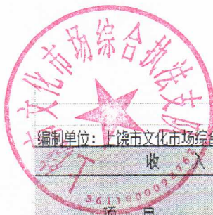
财政拨款收入支出决算总表