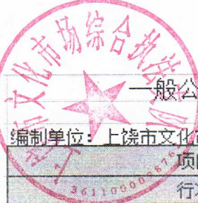
一般公共预算财政拨款“三公”经费支出决算表