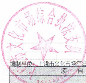
国有资本经营预算财政拨款支出决算表