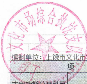
一般公共预算财政拨款支出决算表