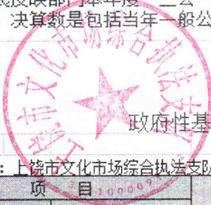
政府性基金预算财政拨款收入支出决算表

注：本表反映部门本年度“三公”经费支出预决算情况。其中，预算数为“三公”经费年初预算数，决算数是包括当年一般公共预算财政拨款和以前年度结转资金安排的实际支出。