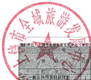
财政拨款收入支出决算总表