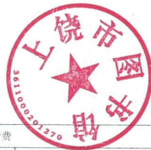
项目支出绩效自评表 (2021 年度)

科技图书馆运行费项目绩效自评总体综述：根据年初设定的绩效目标，科技图书馆运行费项目绩效自评得分为 97.9 分。项目全年预算数为 60 万元，执行数为60万元，完成预算的 100 %。项目绩效目标完成情况：一是保障图书馆大楼的整体运行；二是对大楼物业采取政府采购形式，建立健全图书馆大楼物业及安保。发现的问题及原因：一是绩效管理相关业务知识有待进一步提高；二是绩效目标管理规划还有较大提升空间。下一步改进措施：一是进一步加强对绩效管理相关政策文件的学习；二是向上级主管部门汇报学习绩效管理相关的经验和成效。