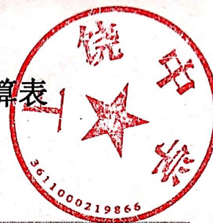
收入支出决算总表